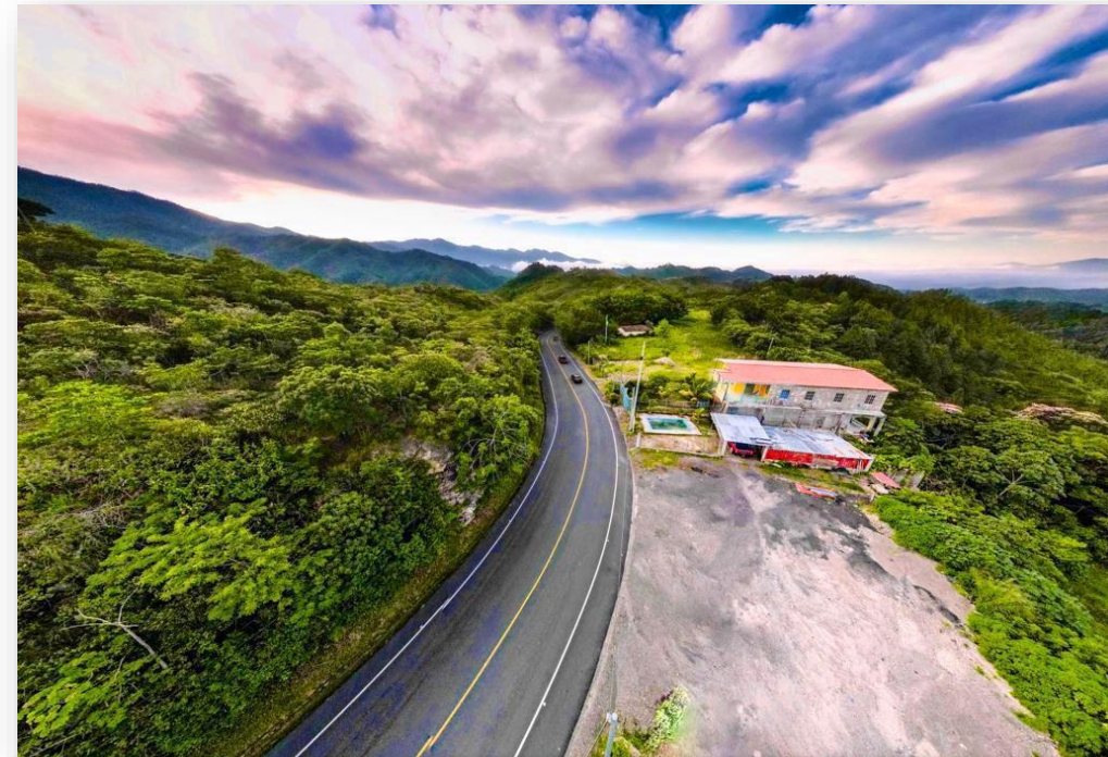
Renovación carretera El Poy